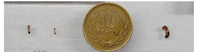
働きアリ 女王アリ ヒアリの大きさ 体長約2.5~6mm 体長約7~8mm